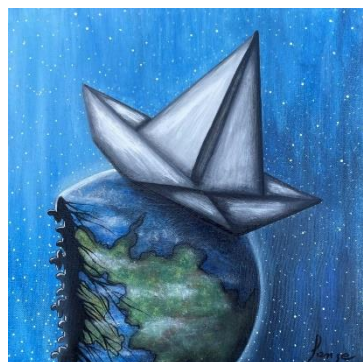
La terre est ronde, acrylique

Dans chacune de ses créations, elle fait un clin d'œil au casse-tête. Ces pièces déformées la fascinent. Un morceau peut être apposé au mauvais endroit pour un certain temps, mais à force de cheminer, il retrouvera sa place et complètera l'image. Quoi qu'il arrive, les pièces s'emboîteront toujours!