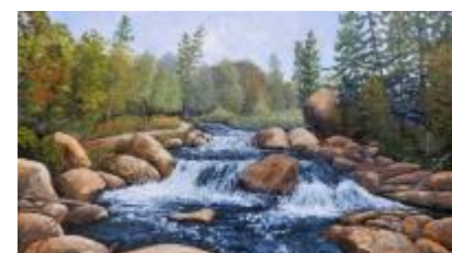
Rivière Doncaster, acrylique