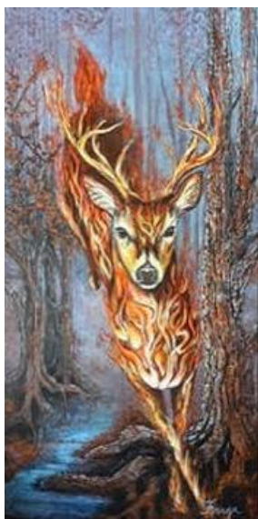
Renaissance Acrylique 24 X 12