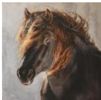
Rebelle Acrylique 24 X 24