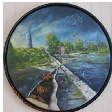
L'envol des Monarques Huile 30 po.

le sujet traité, on reconnaît sa signature.